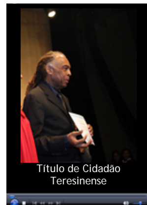
Título de Cidadão Teresinense