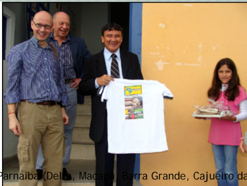
Parnaíba (Delmiro, Macaíba, Barra Grande, Cajueiro da Parnaíba) Apoio ao intercâmbio

O Estado pretende selecionar 10 alunos da rede pública estadual de Picos, Pedro II, Teresina, Piripiri e Campo Maior para ida, posterior, a São Paulo, numa viagem de 10 dias, para conhecer os dois projetos sociais.