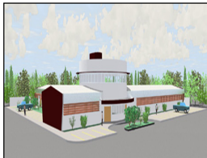
Ilustração do prédio da Policlínica de Picos

hospital do interior do Piauí. Os recursos para construção daquele empreendimento de saúde são oriundos do governo estadual e da prefeitura através convênio.